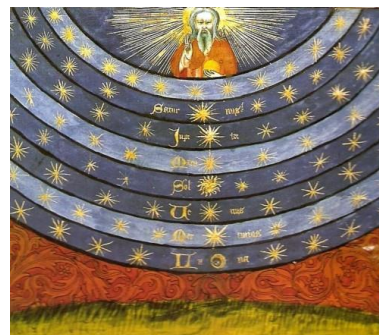
Figura 1.1: Tomado de: Livre du ciel et du monde

Los problemas económicos no le son indiferentes: Él muestra en su Tractatus de origine, natura, jure et mutationibus monetarum ( 1355) (Tratado del origen, la naturaleza, el derecho y las fluctuaciones de