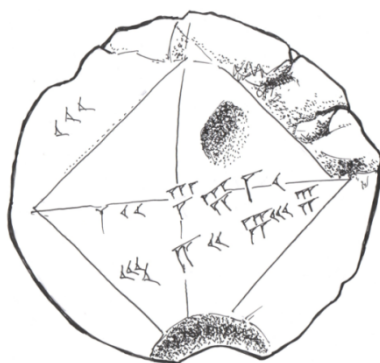
Figura 1.3: Tablilla babilónica YBC 7269 (Stewart, 2007). Ilustración elaboración propia.

La instalación de la aritmética y el álgebra como disciplinas independientes de la geometría fue una situación gradual en Grecia. Arquímedes, Apolonio y Ptolomeo usaron la aritmética solo para calcular cantidades geométricas. Por su parte, Herón, Nicomaco y Diofanto utilizaron la aritmética y el álgebra en forma independiente de la geometría (Ruíz, 2003).