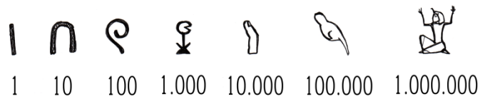
Figura 1.2: Números egipcios (Sáenz, 1994). Ilustración elaboración propia.

Con el correr de los años, las marcas realizadas en tablillas y huesos fueron transformándose en incipientes pictogramas y elementos simbólicos que representan palabras a través de las imágenes (figura 1.2).